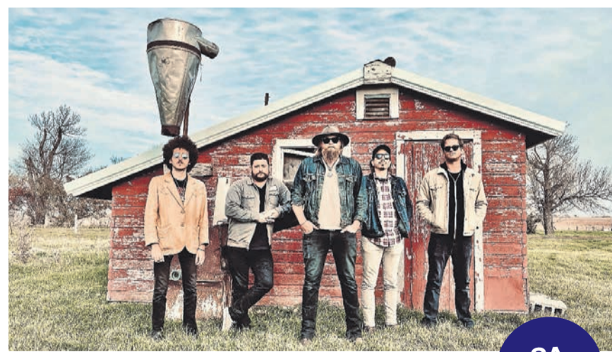
Die kalifornische Band Robert Jon & The Wreck.