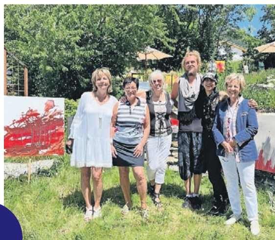
Künstlerinnen und Künstler aus dem Unter- und Oberwallis stellen in Guttet aus.